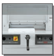
Carter de protection avant