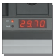
Affichage digital des dimensions